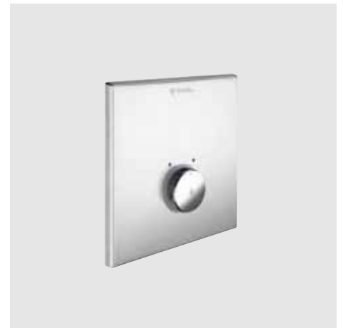
Ducha empotrada temporizada mezcladora y no mezcladora SCHELL LINUS D-SC-M/LINUS D-SC-V