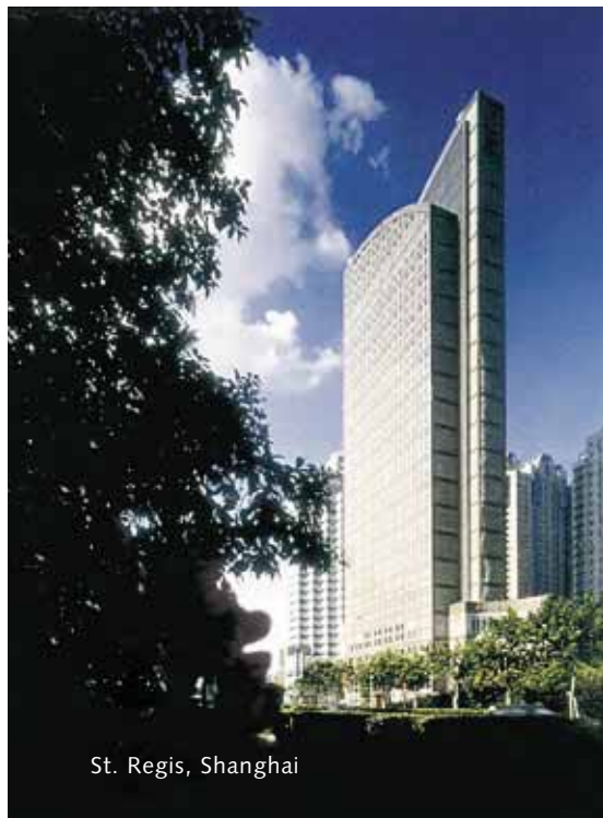
St. Regis, Shanghai