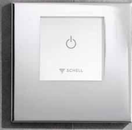
Ducha empotrada electrónica no mezcladora LINUS D-E-V