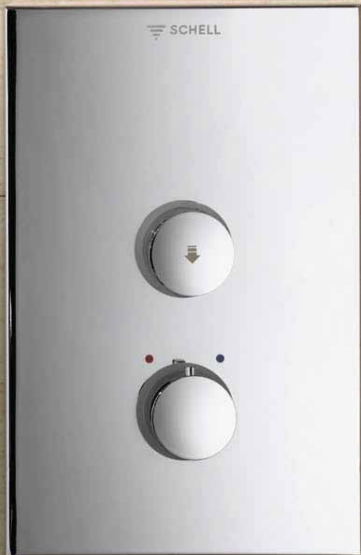
Ducha empotrada temporizada con termostato LINUS D-SC-T