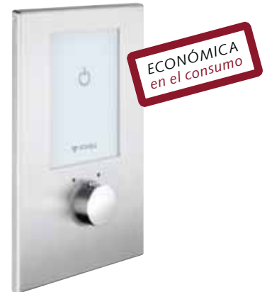
Ducha empotrada electrónica termostática LINUS D-E-T

Con la función «Shower Control Eco», LINUS controla mediante un sensor de radar situado detrás del cristal de seguridad el ámbito de la ducha y apaga la descarga de agua cuando el usuario abandona el mismo antes incluso de que hubiera finalizado el tiempo de descarga predefinido.