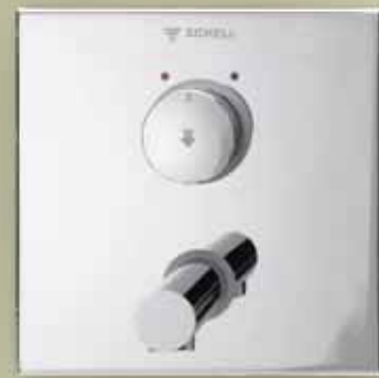
Montaje de grifería mural para lavabo LINUS W-SC-M