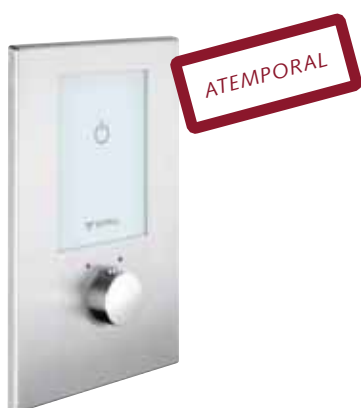
Belleza atemporal. Ducha empotrada electrónica termostática LINUS D-E-T