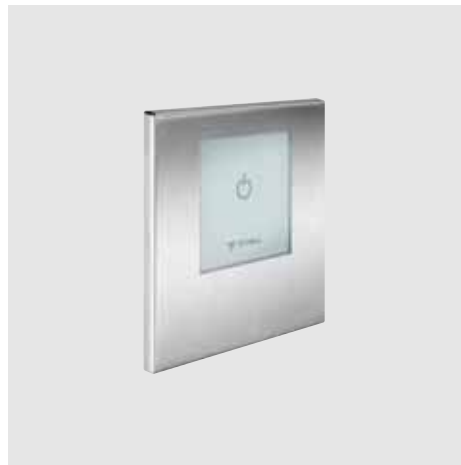
Ducha empotrada electrónica no mezcladora SCHELL LINUS D-E-V