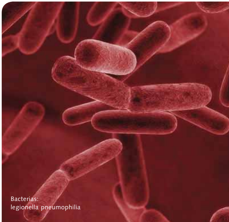
Bacterias: legionella pneumophila