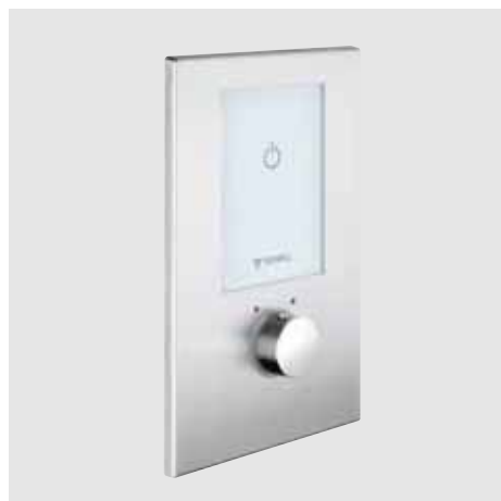
Ducha empotrada electrónica termostática SCHELL LINUS D-E-T/LINUS D-E-T Eco