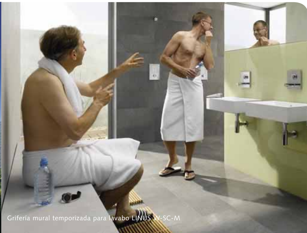
Grifería mural temporizada para lavabo LINUS W-SC-M