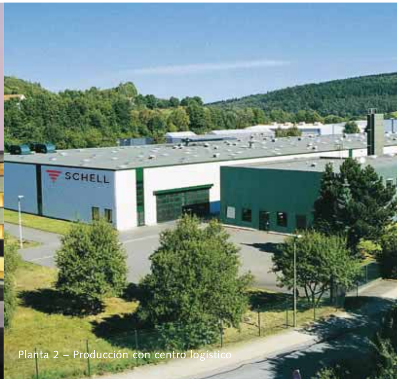
Planta 2 – Producción con centro logístico