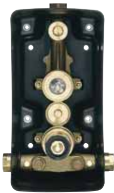
La Masterbox II de SCHELL puede equiparse de manera opcional con una válvula adicional para la desinfección térmica.

Las superficies lisas y los bordes redondeados de la grifería LINUS ofrecen a la suciedad poca superficie donde esconderse. Con estas formas la grifería proporciona una mayor higiene al facilitar una limpieza perfecta, un punto a favor para su uso, por ejemplo, en hospitales, residencias geriátricas etc.