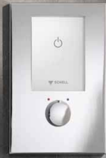
Montaje de ducha empotrada LINUS D-E-T