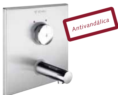
Montaje grifería mural temporizada para lavabo. LINUS W-SC-M

LINUS ha sido desarrollado fundamentalmente para espacios sanitarios públicos y semipúblicos con condiciones de uso intensivo. La grifería mural temporizada para lavabo está disponible en versión mezcladora o para agua premezclada.