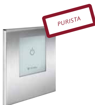
Reducción a lo esencial. Ducha empotrada electrónica no mezcladora LINUS D-E-V para agua premezclada