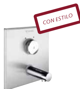
También técnicamente convincente. Grifo mural temporizado mezclador LINUS W-SC-M con regulador de caudal antirrobo

Las líneas claras de LINUS cumplen las máximas exigencias en cuanto a diseño y estética y crean las condiciones para un funcionamiento perfecto. La pantalla frontal de la grifería destaca por su reducido tamaño, contornos exteriores ligeramente redondeados y un campo del sensor de grandes dimensiones.