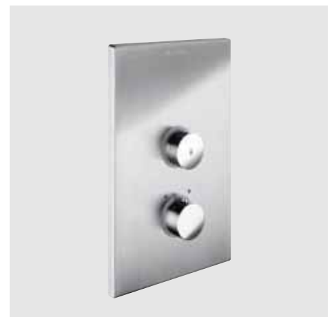
Ducha empotrada temporizada termostática SCHELL LINUS D-SC-T