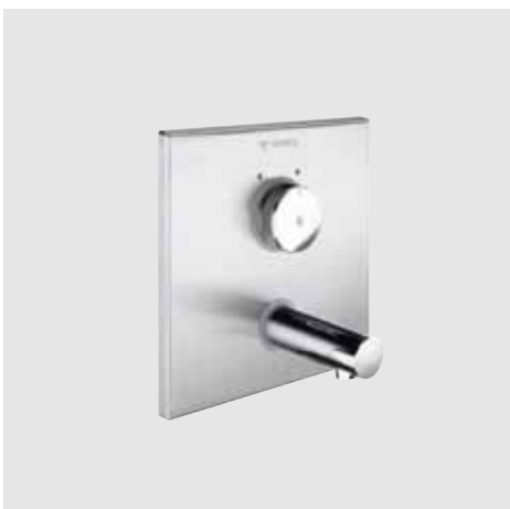
Grifo empotrado mural temporizado mezclador y no mezclador SCHELL LINUS W-SC-M/LINUS W-SC-V