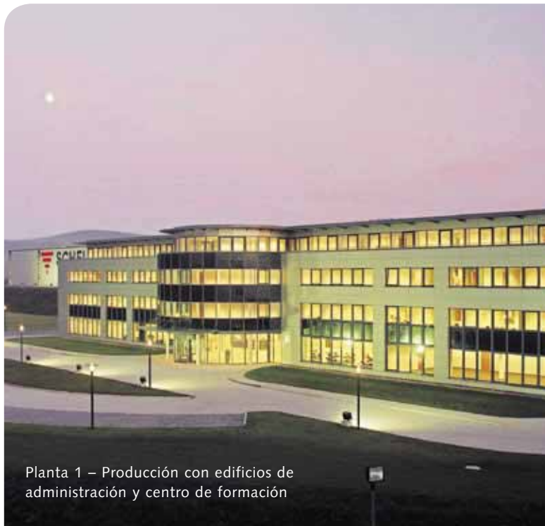
Planta 1 – Producción con edificios de administración y centro de formación