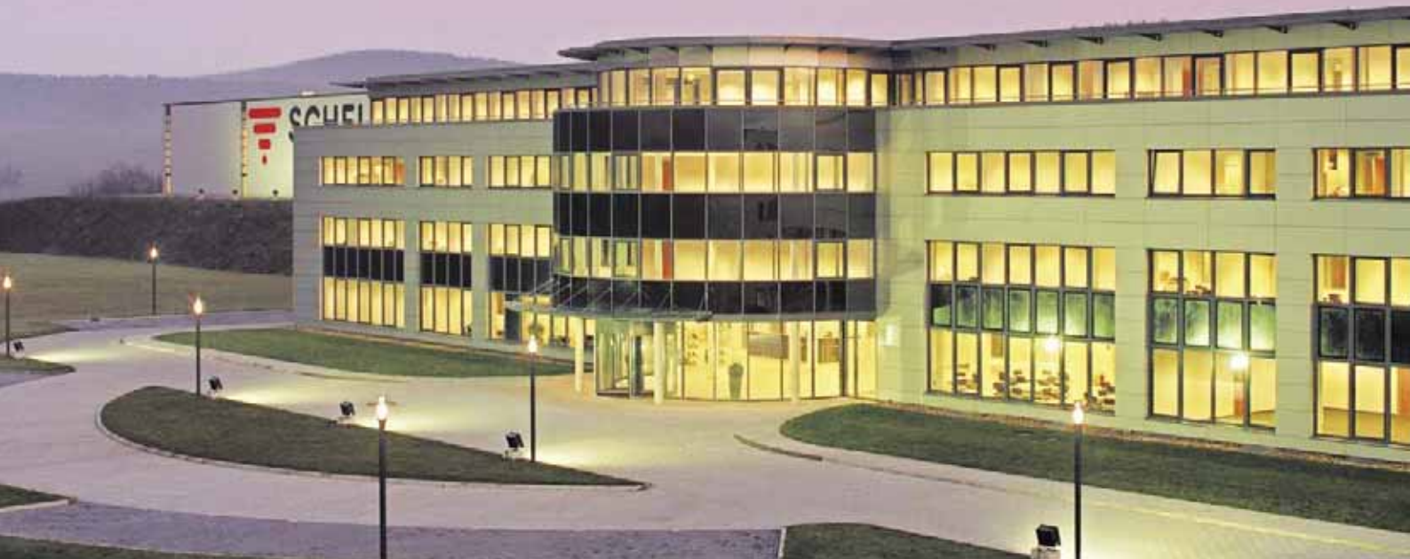
Planta 1. Producción con Oficinas Centrales y Centro de Formación