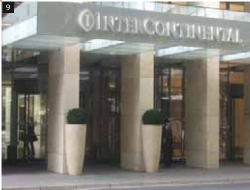
9 InterContinental, Düsseldorf