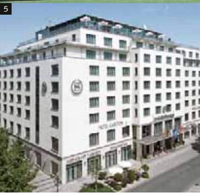
5 Hotel Sheraton Carlton, Nürnberg