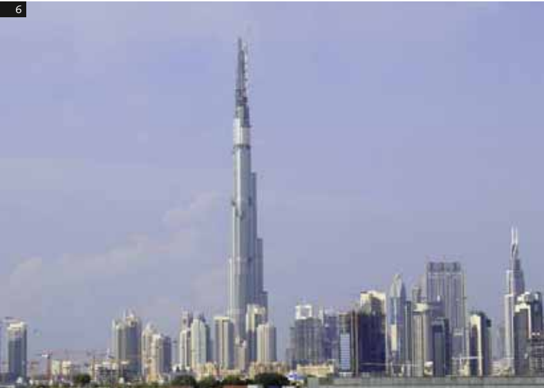
6 Burj Khalifa Complex, Dubai