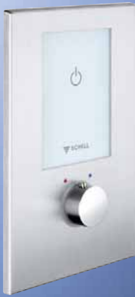
Grifería electrónica termostática empotrada para ducha LINUS D-E-T ECO