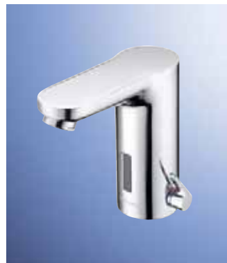
Griferías para lavabo y ducha

Para los espacios sanitarios modernos. Con distintas versiones electrónicas y temporizadas. Higiénicas, fiables y cómodas en su uso. Página 8