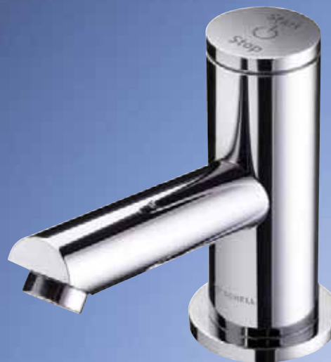
Grifo piezoeléctrico TIPUS P