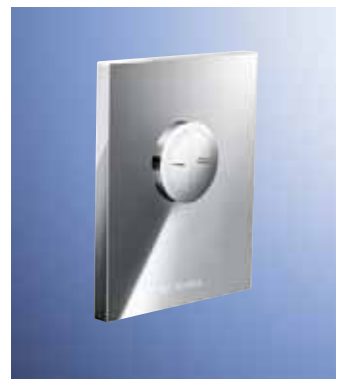
Sistemas de descarga para inodoros y urinarios

Con diferentes versiones para ahorro de agua tanto manuales como electrónicos. Especialmente adecuadas para un mantenimiento sencillo y rápido, con versiones adosadas y empotradas con sus respectivos bastidores de montaje para instalaciones nuevas. Página 12