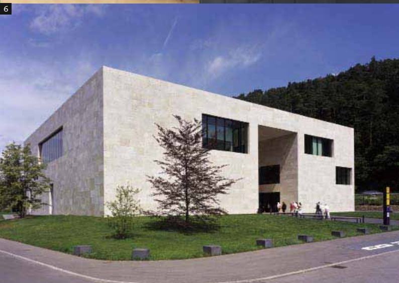
6 Museo del deporte de Ritter, Waldenbuch