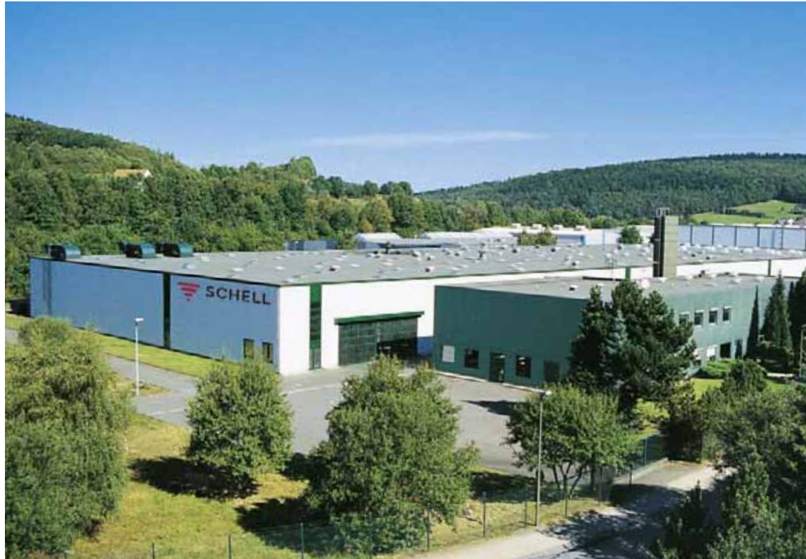
Planta 2. Producción con centro logístico