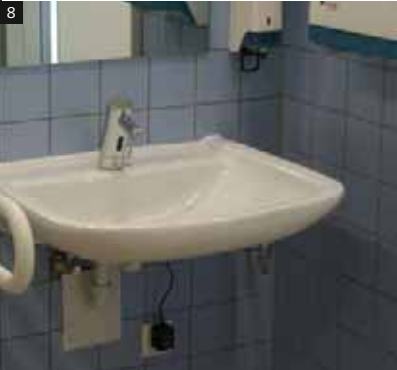
3-4 Parque empresarial Barmeria , Wuppertal