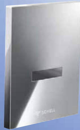
Fluxor electrónico para urinario EDITION