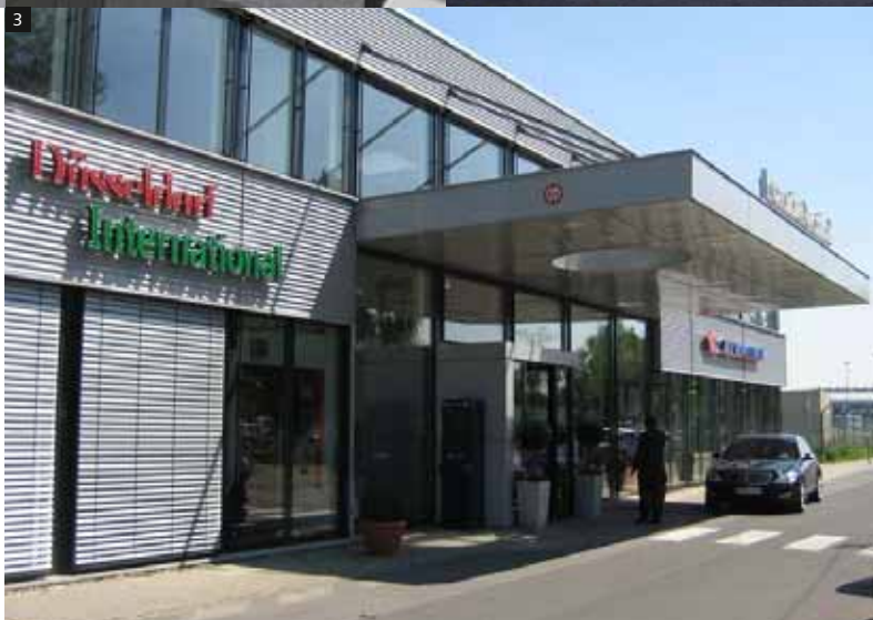
4-5 Erfurter Hof, Erfurt