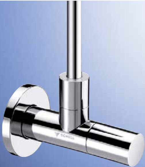
Llave de escuadra de diseño LINE