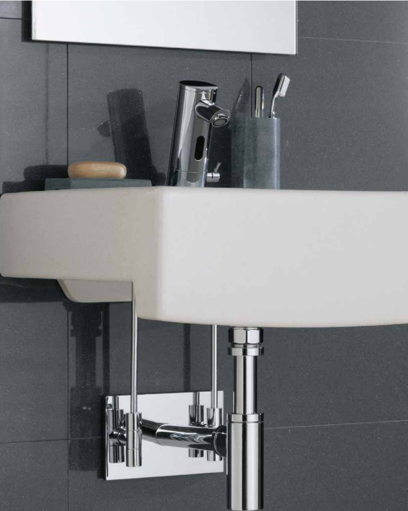
La grifería electrónica PURIS con un conjunto de llave de escuadra de regulación de diseño EDITION.